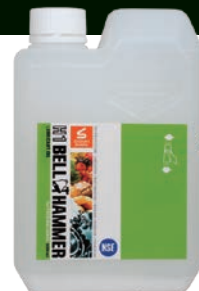
H1ベルハンマー 原液