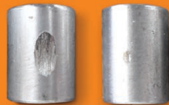
他の潤滑剤 使用時