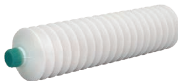
H1ベルハンマー カートリッジグリース No.2