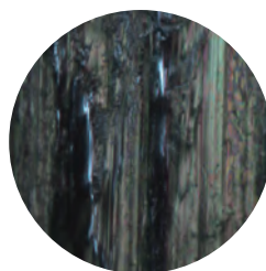
一般的な船舶用エンジンオイル