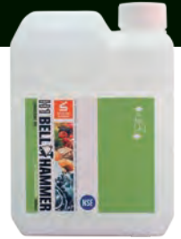
H1ベルハンマー 原液