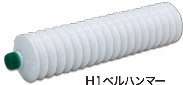
H1ベルハンマー カートリッジグリース No.2

H1ベルハンマーは高精製パラフィンオイルとPTFEをベストバランスで配合した食品機械用潤滑スプレーです。従来のH1潤滑油を圧倒する付着性能・浸透性能を有しており、耐磨耗性能・潤滑性能において素晴らしい効力を発揮します。各種食品製造機械・製造ラインに適量塗布してお使いください。