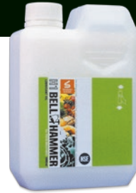
H1ベルハンマー 原液