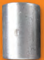
H1 BELL HAMMER 使用時