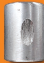
他の潤滑剤 使用時