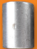
H1 BELL HAMMER 使用時